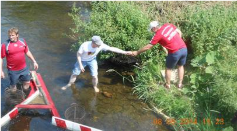
Um 15.23 Uhr hatte die Siegerente das Ziel an der Brücke zum Nussbaumstadion erreicht.