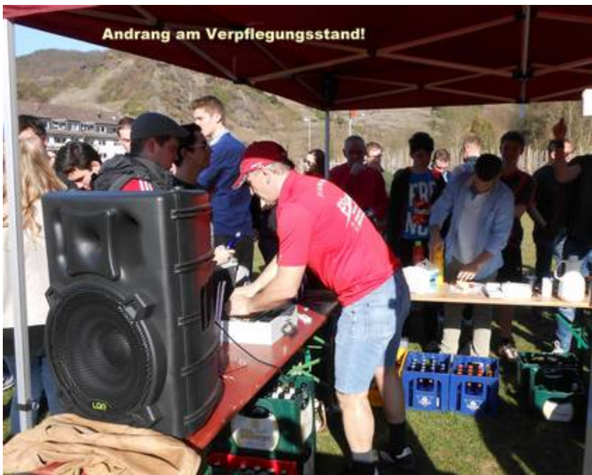
Und auch am Verpflegungs- und Getränkestand herrschte regelmäßig Hochbetrieb.