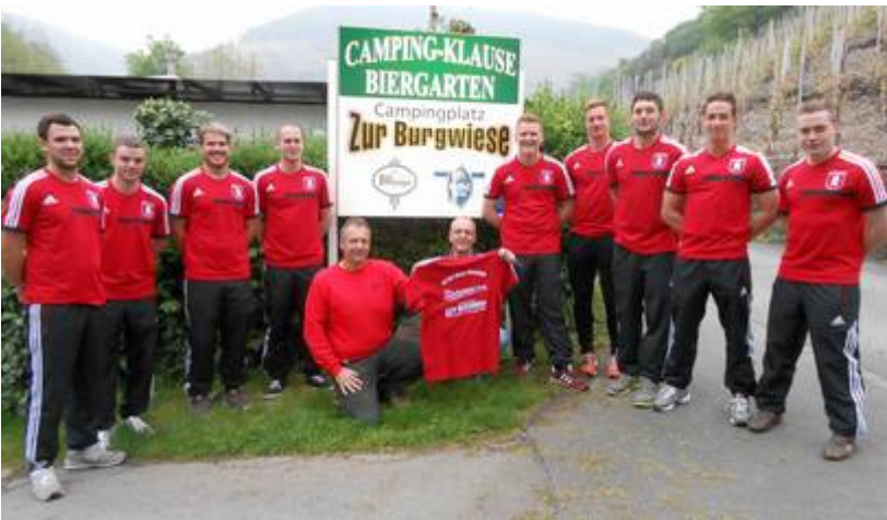
Neue Aufwärmshirts für die 1. Mannschaft gab es am 2. Mai 2014 von den Betreibern des Campingplatzes und der Campingplatz-Klause.