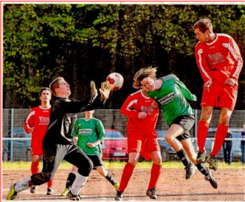
Die SG Franken/Königsfeld/Waldorf (in Grün) kam zu Hause in Königsfeld gegen den SV Mayschoß nach einem 0:2-Rückstand noch zu einem 2:2-Unentschieden.