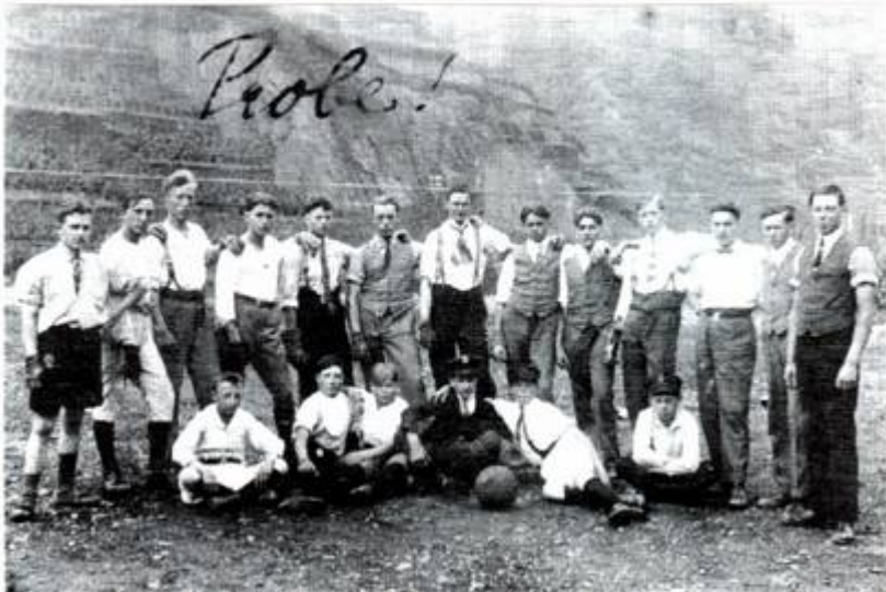
Das Foto wurde vermutlich 1930 aufgenommen. Wer die darauf abgebildeten Personen sind, ist leider nicht bekannt.