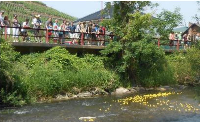
Zum Start an der Lochmühle hatten sich zahlreiche Zuschauer eingefunden.