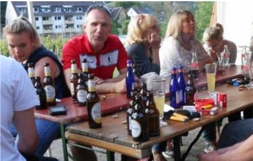
Auch wenn das letzte Heimspiel gegen die SG Franken mit 1:4 verloren ging, wurden anschließend Saisonabschluss und Klassenerhalt gefeiert.