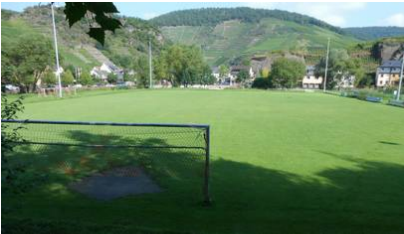
Blick auf das heutige Nussbaumstadion (Juli 2014).