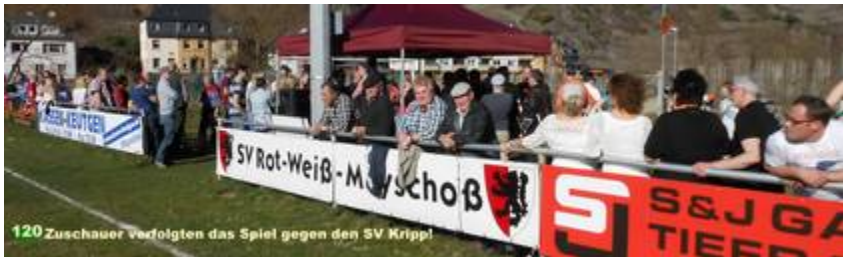
Erfreulicher Zuschauerandrang herrschte bei den Heimspielen der Rot/Weißen in der Saison 2013/2014.