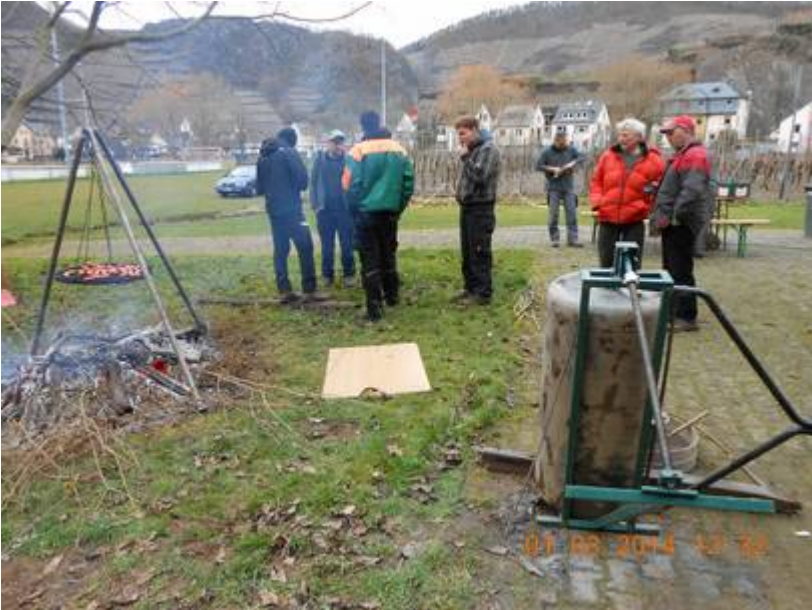
Am 1. März 2014 wurde das Gestrüpp zum Burghang hin beseitigt.