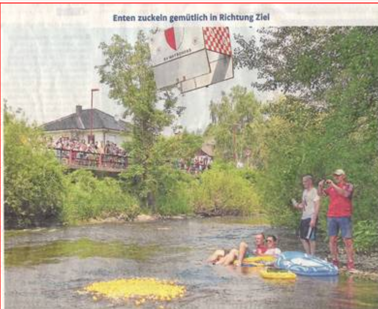
Enten zuckeln gemütlich in Richtung Ziel

Wir liefern alles aus eigener Herstellung – ofenfrisch bis vor Ihre Haustür!