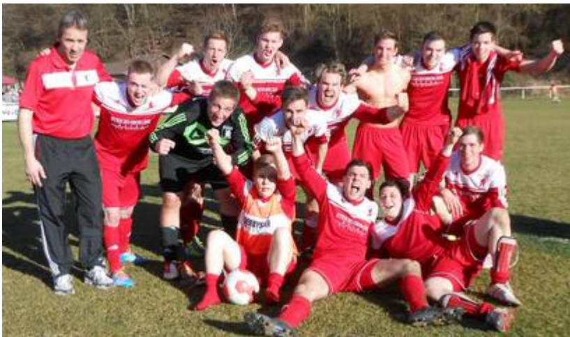
Ausgelassene Stimmung nach dem 5:2 Sieg über den Tabellenzweiten SV Kripp